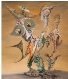
Orfeo Orphée Orpheus 1938 Óleo y fumage sobre tela