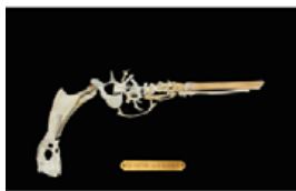
El genio de la especie Le Génie de l'Espèce The Genius of the Species 1938 Hueso