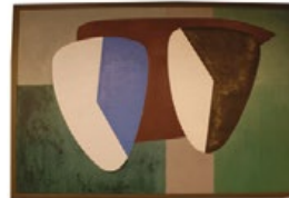
Dos cabezas I Deux Têtes I Two Heads I 1936 Óleo sobre tela