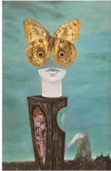
El Vellocoino de oro Toison d'or The Golden Fleece 1937 Óleo sobre tela