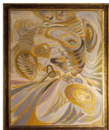
Polaridades cromáticas Polarités Chromatiques Chromatic Polarities 1942 Óleo sobre tela